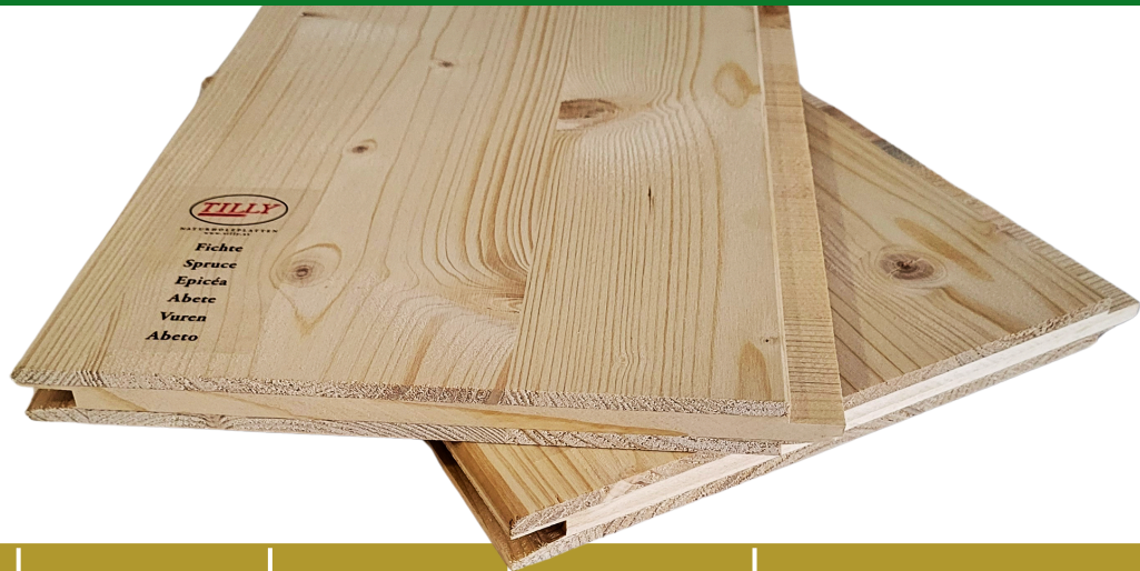
Fichte, Massivholzplatten, Nut + Feder